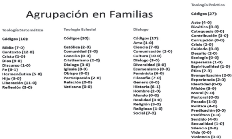
Figura 2. Agrupación por familias.

Posteriormente se pasó a la codificación teórica y a la generación de redes de conceptos agrupados por familias como en la Figura 2.